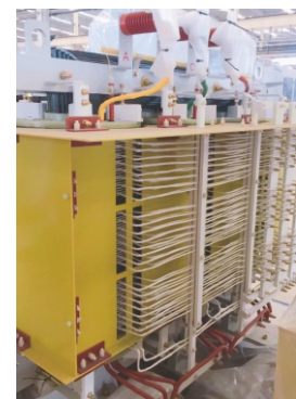
荧光测温主机温度显示