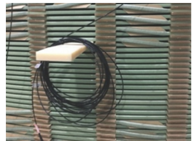
荧光光纤温度传感器在变压器线圈上的嵌装