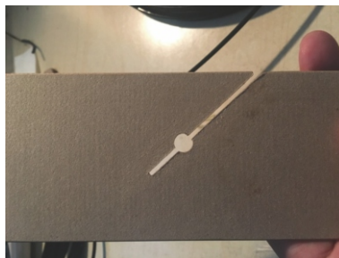
绝缘垫块按照传感器尺寸开固定孔