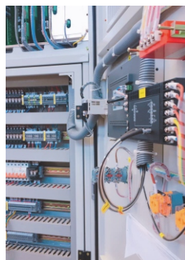
光纤沿波纹管走线