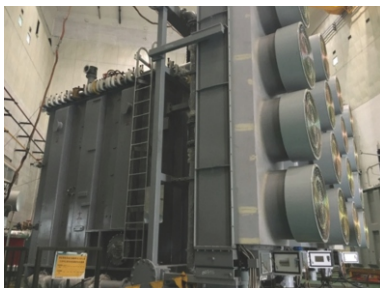
油浸式变压器本体